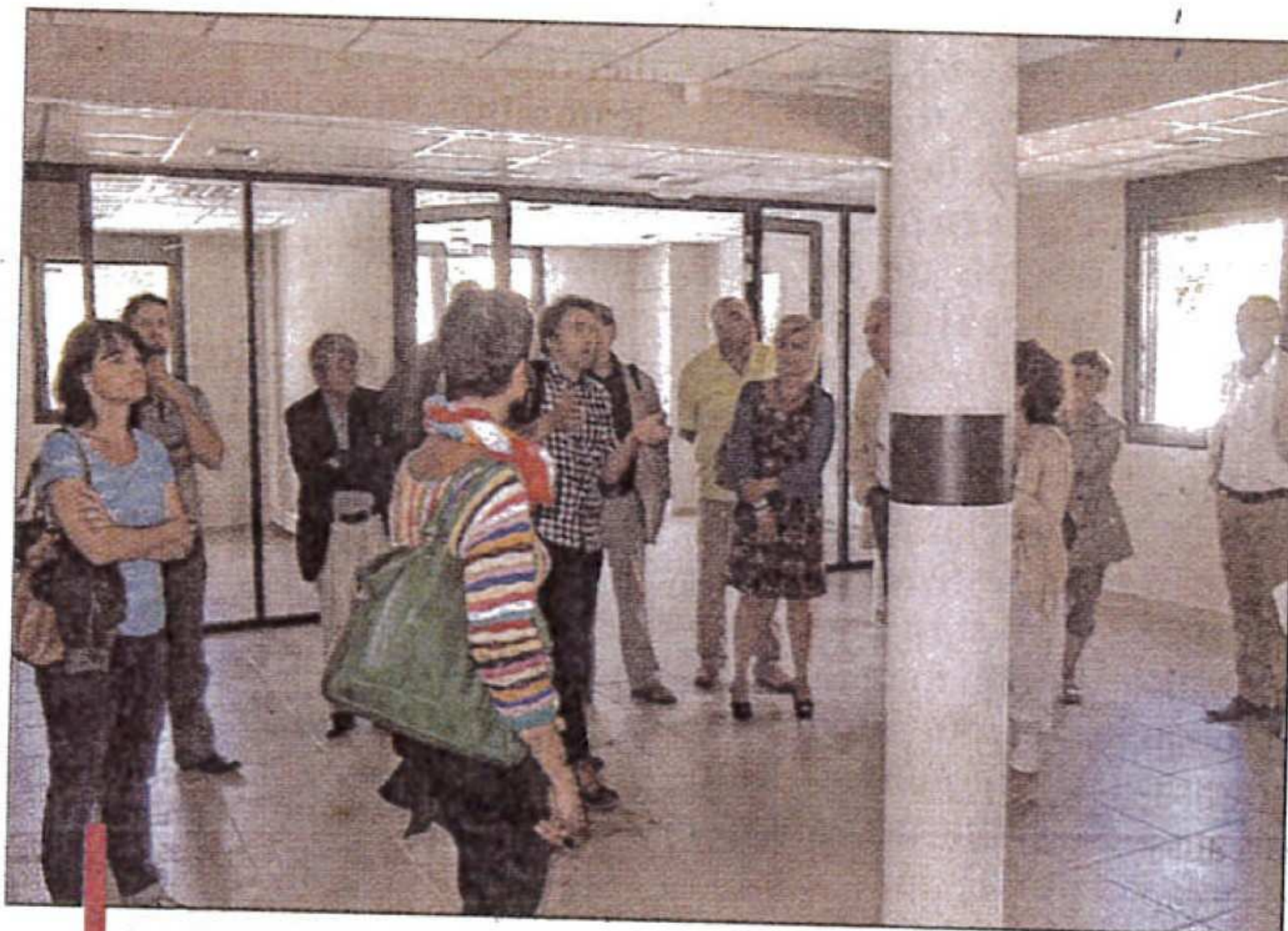
Les bureaux vitrés des deux étages de La Boussole ont été présentés malgré les travaux qui se poursuivent.

te et une opportunité pour l'insertion dans le monde professionnel. "Nous sommes heureux d'avoir réalisé cet outil. C'est une réponse à la politique d'emploi de la région", se réjouit le maire d'Aubagne, Daniel Fontaine. Un projet en cohérence avec les nombreuses demandes d'emploi mais aussi avec l'aspect écologique des bâtiments. "Les locaux sont phénoménaux. On réutilise le chaud, le froid et même au niveau de l'aspect, il s'inscrit bien dans le centre-ville d'Aubagne", confie Daniel Fontaine. La nouvelle structure dédiée à l'emploi de l'Agglo sera livrée en septembre.